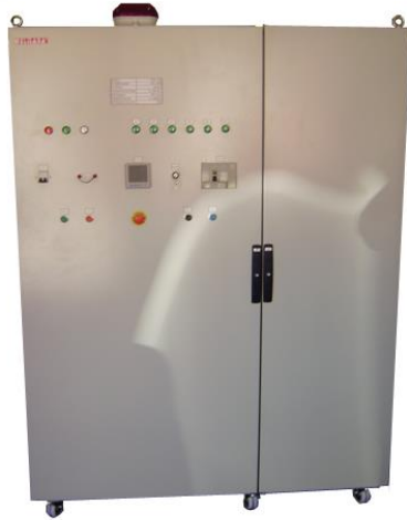
Variador de tensión Motorizado